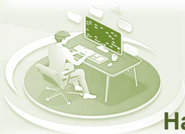
Наталія ДОБРЯНСЬКА провідний бібліотекар відділу обслуговування навчальною літературою